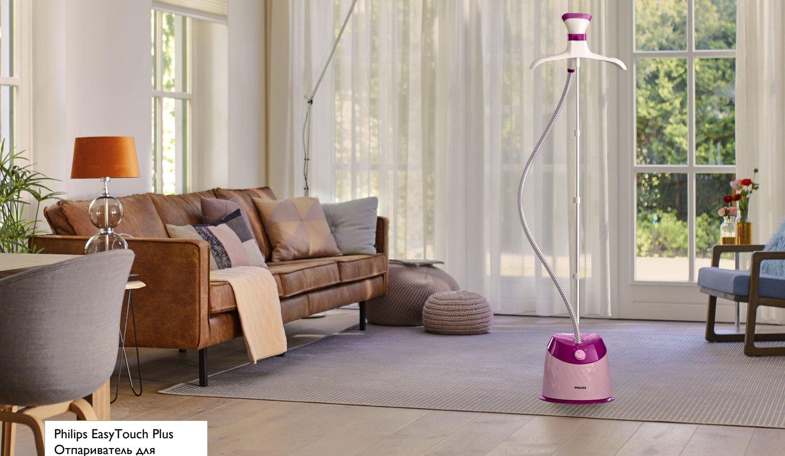
Philips EasyTouch Plus Отпариватель для одежды